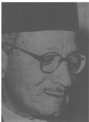
حسن الهضيبي خليفة حسن البنا في زعامة الإخوان